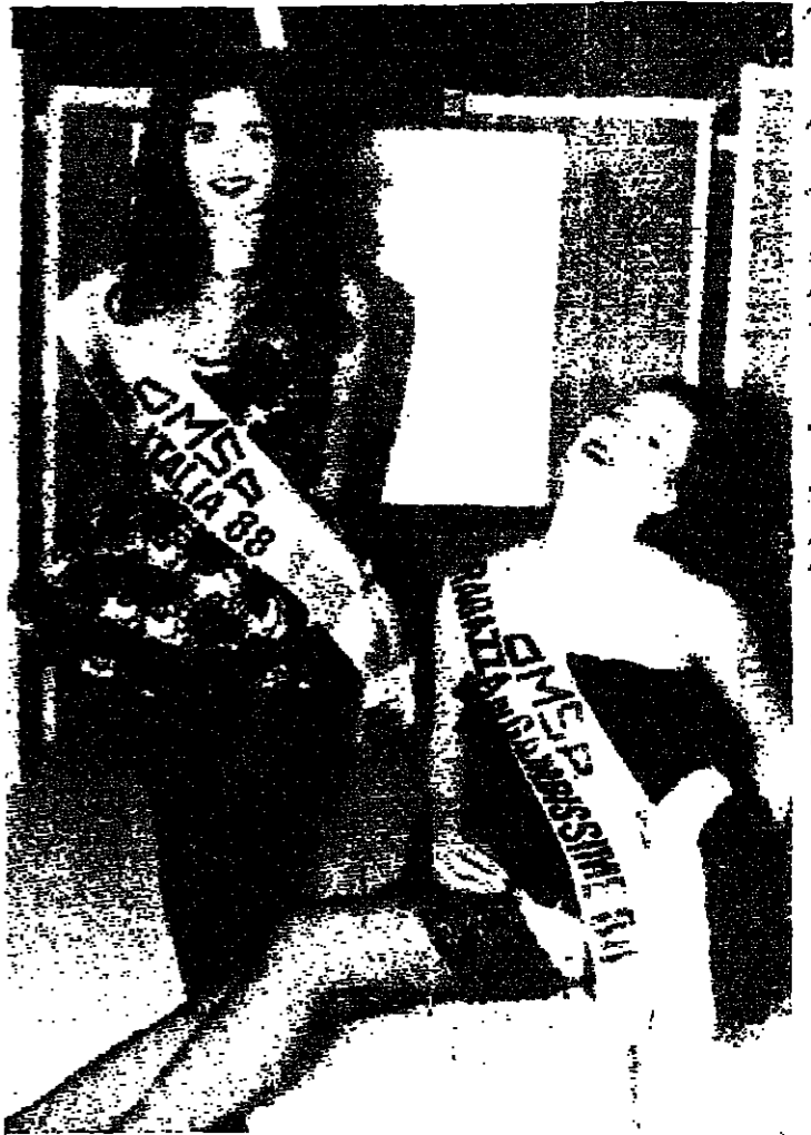
تانيا بونغالا (اليسار)، ملكة جمال إيطاليا لعام ١٩٨٨، ولورا ستيفانيليا (اليمين)، ملكة جمال السويد لعام ١٩٨٨. تعرضت مجموعة الطليق الداخلي لكاريف وشبانه ١٩٨٩-٩٠ العالمة إلى المؤسسة الإيطالية، وأمساء. وجاء هذا العرض كجزء من معرض المصالحون الدولي لـ اللانجيري، الذي أقيم في باريس في ٤ الجاري. باريس - أ ف ب